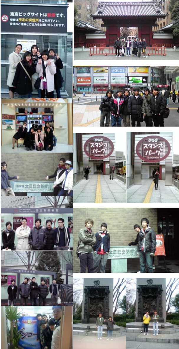
東京都内の様々な研修先を巡る学生たち

いうことをしているかどうか、後々、特に県外でのインターンシップや就職活動などで差を生みます。例えば、研修旅行に参加した学生は、試験や面接を受けるため、希望する大学や企業へ所定の時間までに行かなければならない、といった場面でも旅行の経験を活かして、大都市でも焦らずスムーズに行動できます。研修旅行では、自らルートを設定し、交通機関を利用して移動するという経験も含めて「研修」と考えています。