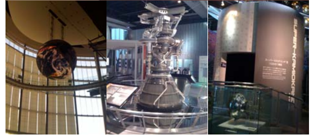
日本科学未来館で見学できる最先端科学

最後の4日目は4学科全体でJALの整備工場見学を行いました。普段見ることのできない、飛行機の整備風景や、飛行機から外されたパーツの数々、そして触れられるほどの距離から眺める飛行機に学生たちは圧倒されていました。