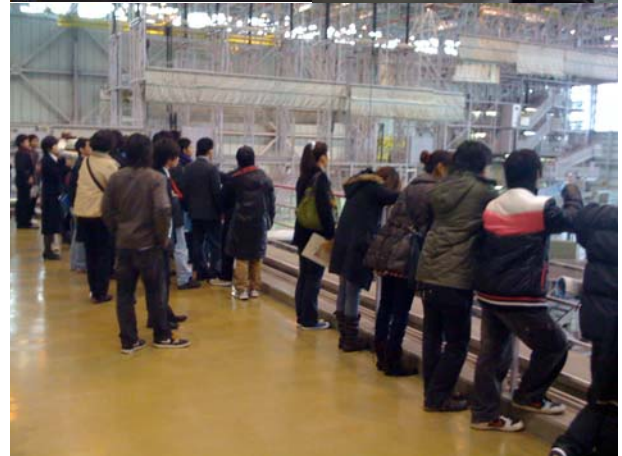
JAL機体整備工場で見学する学生たち

沖縄県から一度も県外へ出たことがない学生にとっては、研修旅行が最初の大都市での経験となるため、この機会にJRや地下鉄、あるいはバスなどの交通機関を利用して、様々な場所へ移動すると